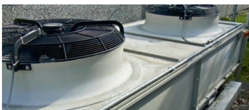
Abbildung 1: Rückkühler.

TRANSPORTAUFTRAG. Lediglich eine mündliche Vereinbarung, besser ausgedrückt, eine Bitte, den Rückkühler mit der Druckmaschine umzuziehen, wurde zwischen den Parteien Kunde, Maschinenhersteller (als Umzugs-Generalunternehmer) und der Spedition getroffen. Schriftliche Verträge wurden hierfür nicht geschlossen. Betrachtet man den aktuellen Zeitwert für den erst fünf Jahre alten Rückkühler (Abbildung 1) in Höhe von ungefähr 16 000 Euro, dann ist eine solche nur mündlich ausgesprochene „Transport-Bitte“ schon sehr risikobehaftet, sollte ein Schaden beim Abbau, der Verladung, dem Straßen-transport und der Abladung eintreten.