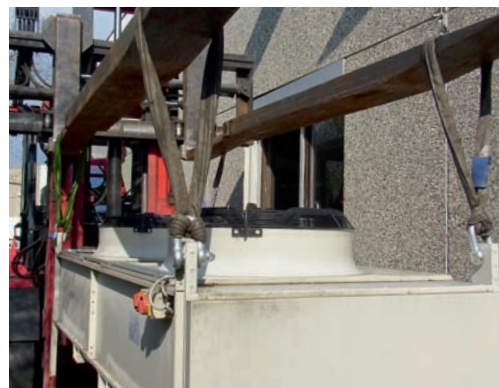
Abbildung 3: Rückkühler richtig verladen.