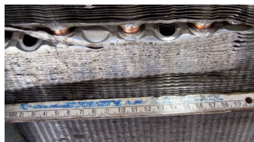
Abbildung 2: Beschädigter Lamellenunterboden.

Man erkennt ganz deutlich in Abbildung 2, wie die Lamellen in Längsrichtung gequetscht wurden. Auch die deutliche Ausdehnung des Schadensbildes in Querrichtung ist sichtbar. Da